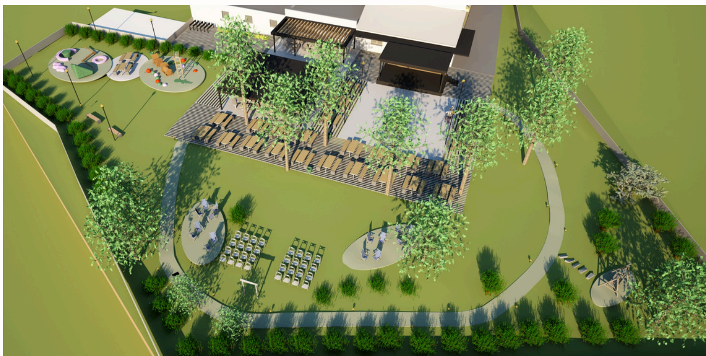
Obrázek: Architektonická studie rekonstrukce "výletišť"