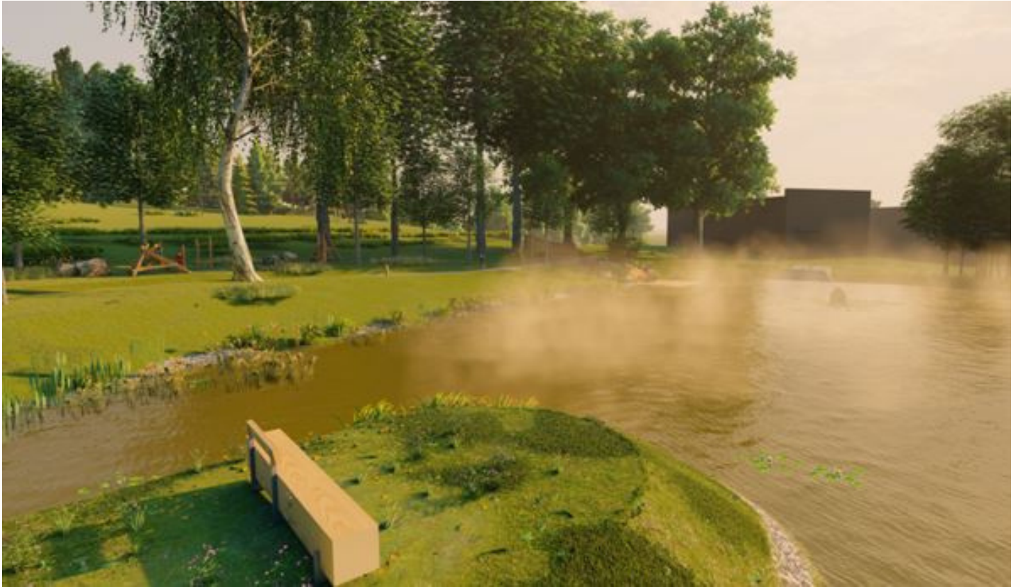
Obr. č.1 – Veřejné prostranství – relaxační a klidová zóna u rybníka