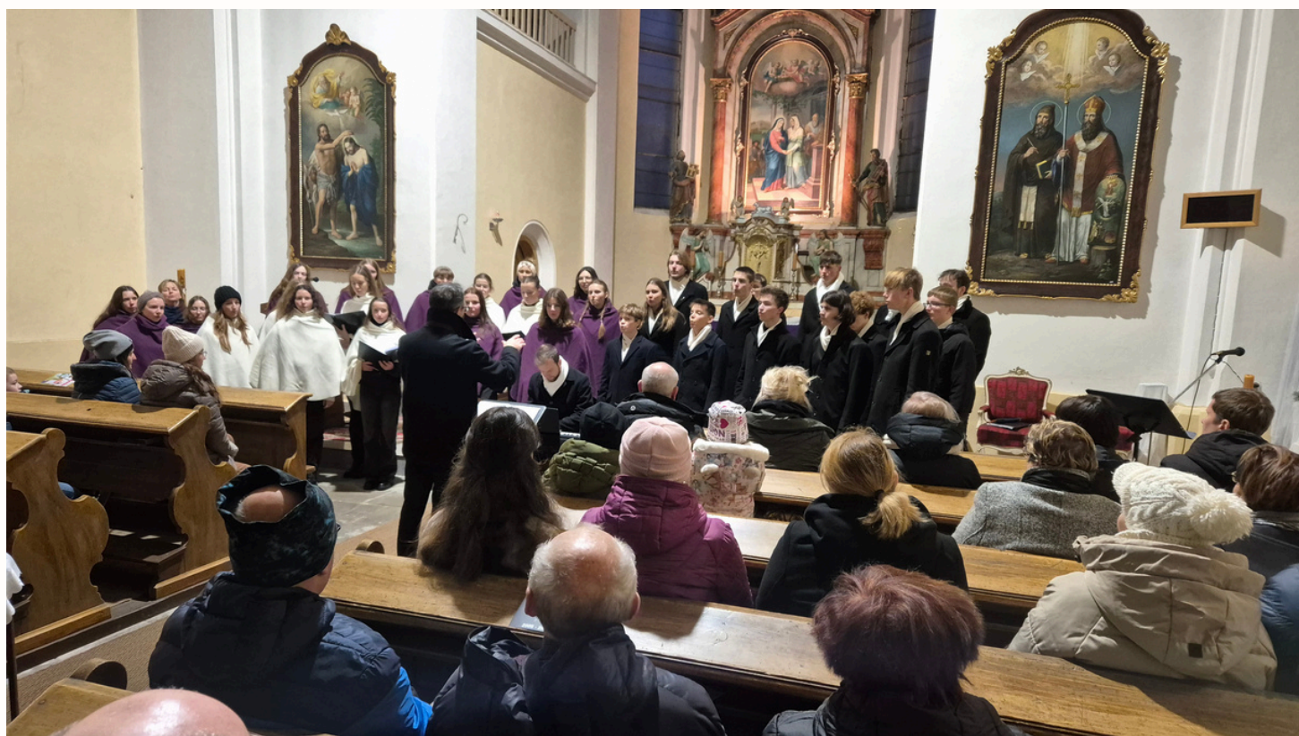
Fotografie z vánočního adventního koncertu PUELLAE et PUERI a SEXTET plus