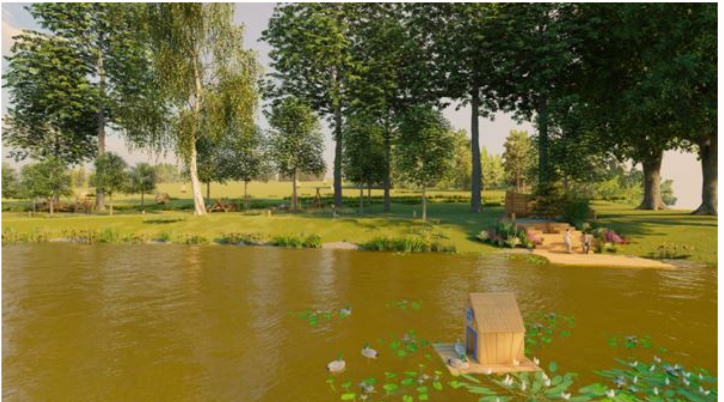
Obr. č.2 – Veřejné prostranství – relaxační a klidová zóna u rybníka